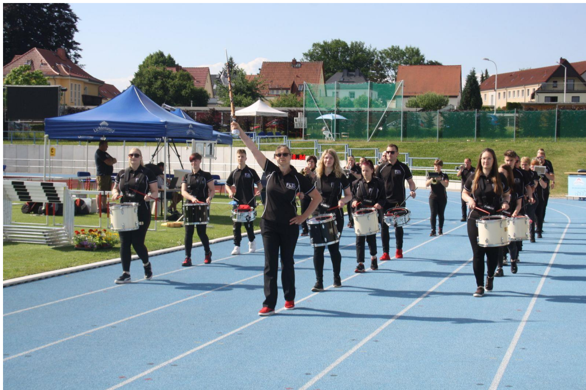
Foto: Fanfaren- und Trompetenkorps Zschopautal e.V. (Landesmeisterschaften Mittweida 2022)